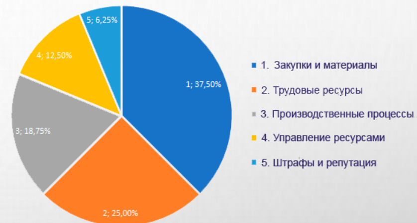
Структура необоснованных затрат